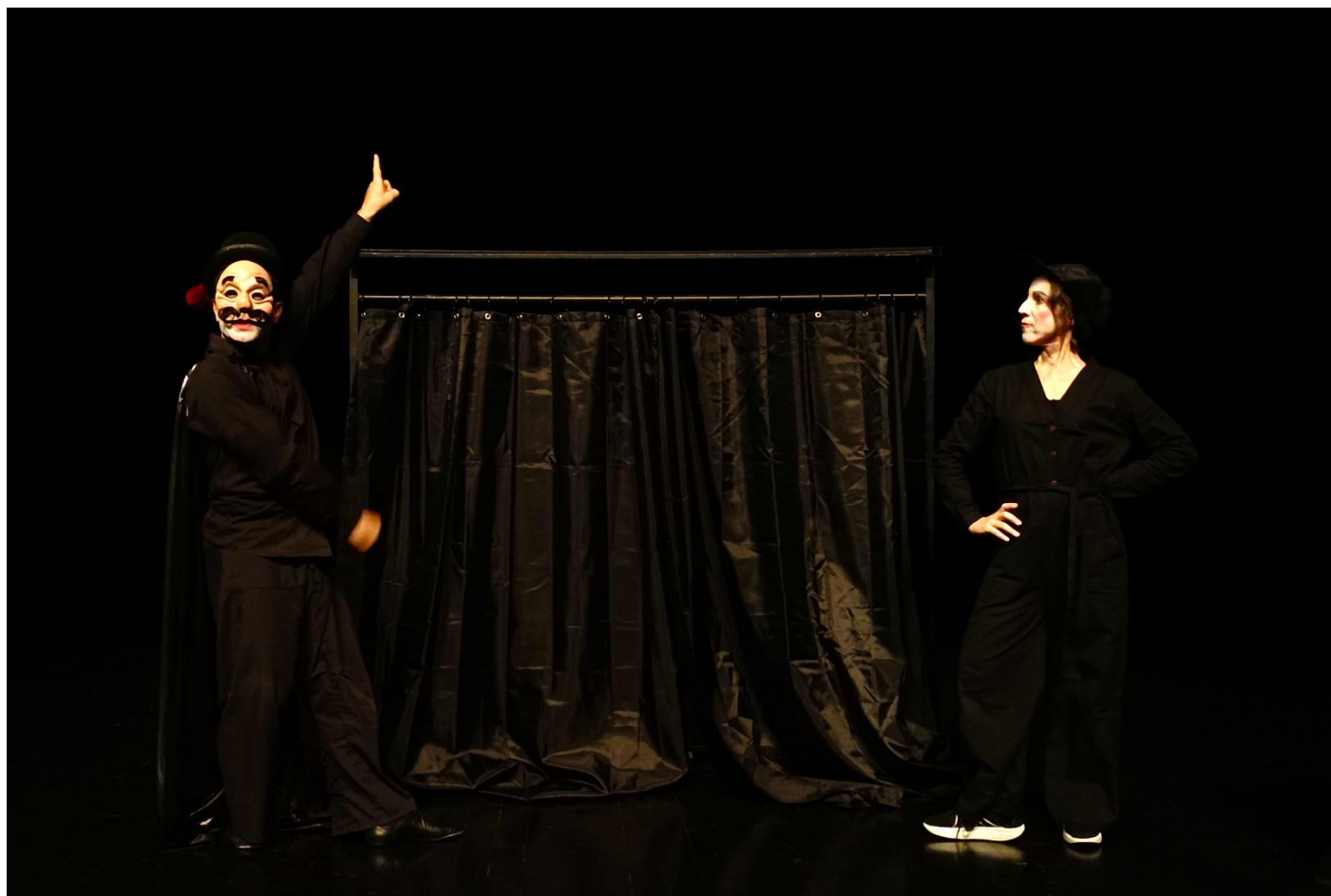
Photo de travail de recherche

Le dispositif permet de se cacher derrière, d'apparaître devant, au-dessus ou à travers, devient castelet ou substitut d'écran de cinéma, les changements de personnages et de décor se déroulant aussi bien à vue que dissimulés.