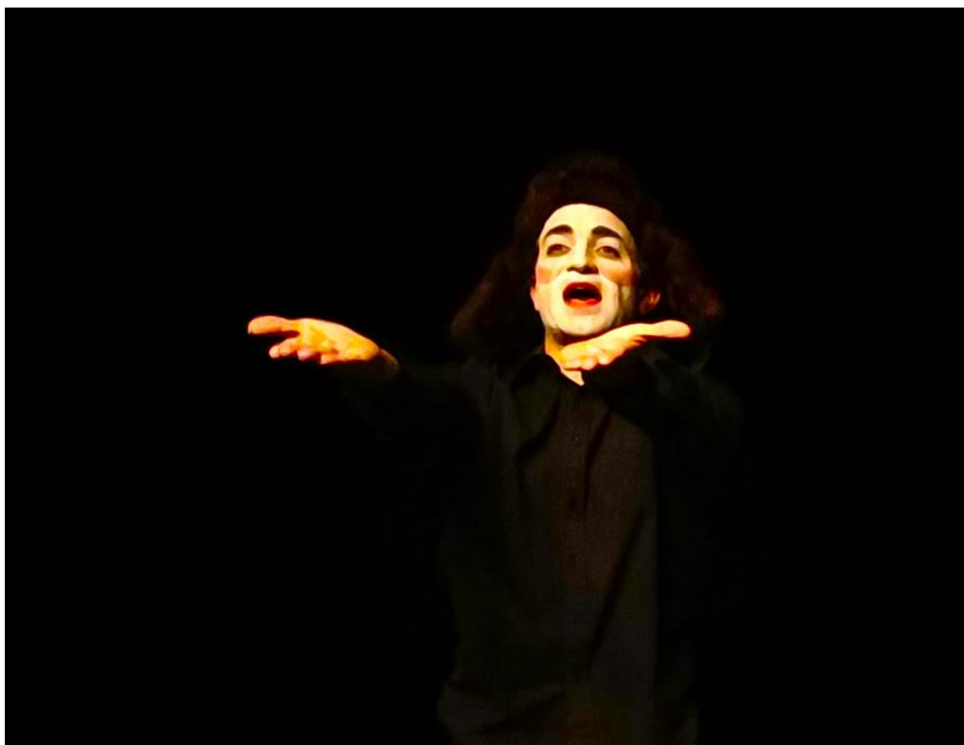
Photo de recherche sur le personnage de JC Suco